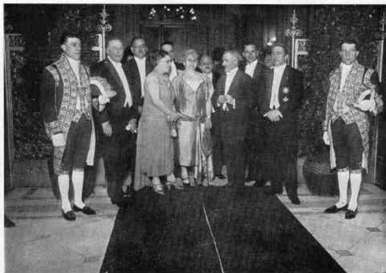
Ricevimento al palazzo della città di Berlino.