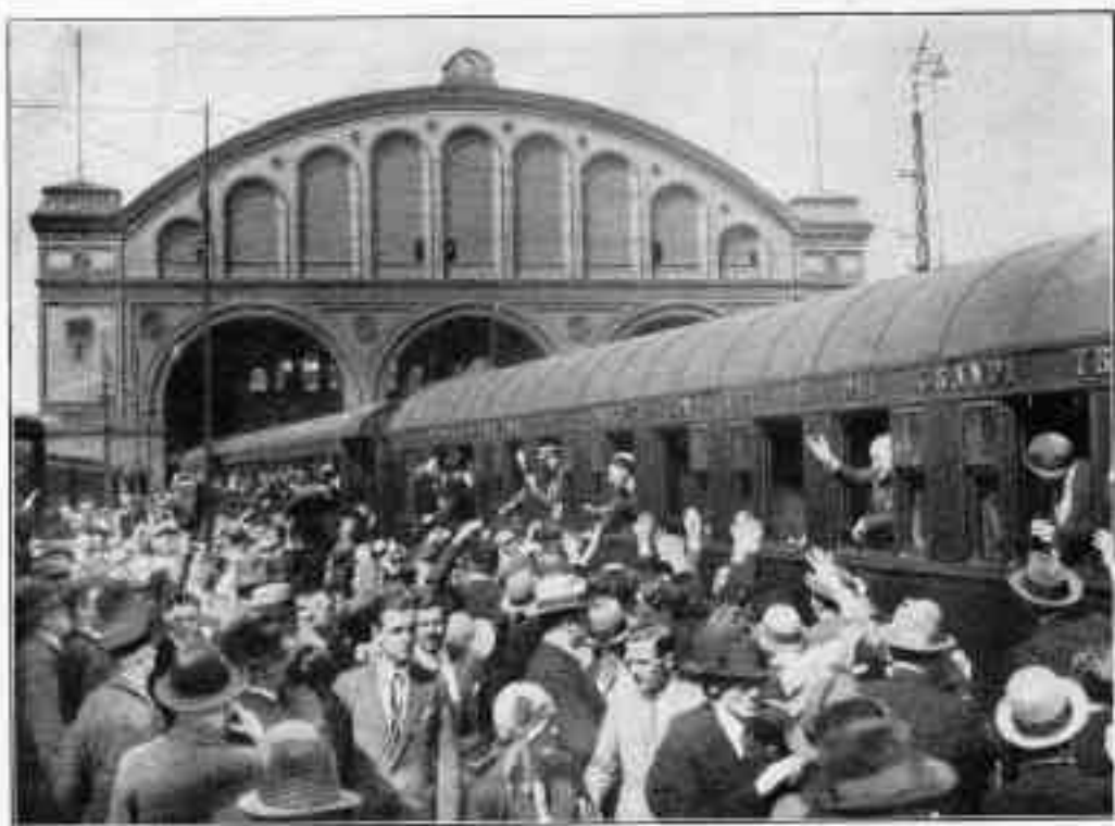
La partenza (Anhalter Bahnhof).