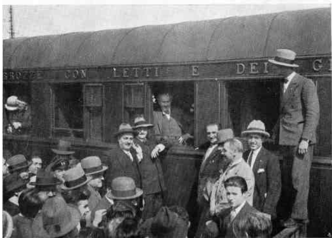
La partenza (Anhalter Bahnhof, Berlino).