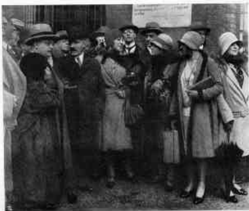
L'arrivo a Berlino.